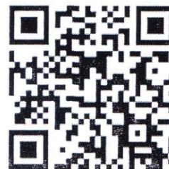
Электронная версия книги

Организатор конкурса «Время писать книги – 2024»: АНО Центр культурных инициатив «Лицей» (г. Москва). Партнёры: Ассоциация союзов писателей и издателей России (АСПИР), Федеральное государственное бюджетное научное учреждение «Институт изучения детства, семьи и воспитания» (ФГБНУ ИИДСВ), Союз детских и юношеских