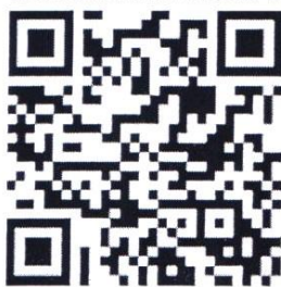
Образовательный проект ВШЛ

Видеоматериалы и музыкальные треки, созданные ребятами, были размещены в сети Интернет, для их просмотра сгенерированы QR-коды. Использование QR-кодов сделало книгу более интерактивной и информативной. После того, как были утверждены все главы, началась сборка книги для печати. Дизайн и вёрстку книги производили с использованием шаблона, представленного образовательным проектом ВШЛ. Ознакомиться с проектом и его возможностями можно по представленному QR-коду.