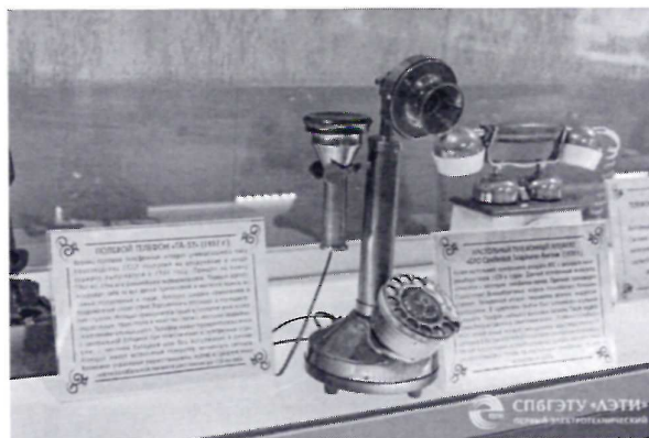
Рисунок 1. Интерактивный музей «Россия в научно-техническом прогрессе: от славного прошлого к уверенному будущему»

С 2019 года в образовательный процесс «Школы — технопарка «Кудрово» включен содержательный контент Интерактивного музея развития науки, техники и технологий «Россия в научно-техническом прогрессе: от славного прошлого к уверенному будущему» (рис. 1), в котором активно реализуются интерактивные технологии. Это новый опыт интеграции музейной инфраструктуры и инфраструктуры технопарковой лабораторной базы для обеспечения эффективной образовательной деятельности инженерно-технической направленности. К созданию экспозиции музея были привлечены факультет радиотехники и телекоммуникаций и факультет электроники СПбГЭТУ «ЛЭТИ», а также Мемориальный музей им. А. С. Попова. Интерактивный музей стал центром управления