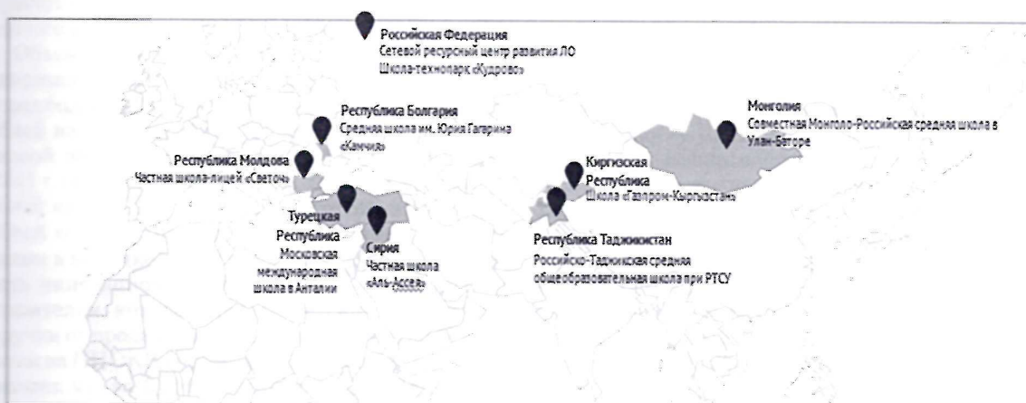
Рисунок 5. Ресурсные центры за рубежом

Просветительские возможности проекта «Школа-технопарк «Кудрово»» чрезвычайно широки. Проводимая работа на базе Р (С)РЦРО ЛО при участии СПбГЭТУ «ЛЭТИ», является практической основой для реализации научно-практического подхода к воплощению модели «Школа-технопарк».